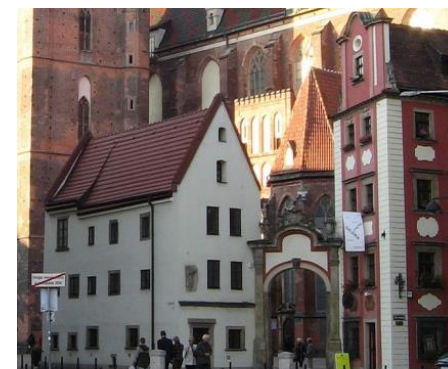
Domky Jeníček a Mařenka na Rynku

V ceně je ubytování na vysokoškolských kolejích, strava od pátku večer do neděle ráno a jízdenka na celý víkend po Wroclawi. Začátkem r. 2014 rozešleme do sborů další informace k přihlášení. Ekumenické oddělení uvítá ale již předtím informaci o Vašem zájmu – zejména pokud uvažujete o hromadnější účasti z Vašich sborů či seniorátů. V takovém případě doporučujeme domluvu ohledně společné dopravy. Vítána je také Vaše ochota jakkoliv pomoci – finanční podpora, dobrovolná služba, technická pomoc apod. Do konce listopadu 2013 ještě ekumenické oddělení přijímá návrhy na příspěvky do programu (kapely, hudební tělesa, výstavy, iniciativy na tržiště možností, přednášky k tématu apod.)