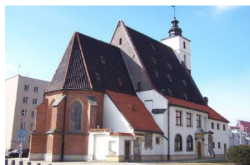
Evangelický kostel sv. Kryštofa ve Wrocławu

dvojjazyčné bohoslužby ve Wrocławu, Śwydnici, Jaworze, Legnicy a Sycoiwie