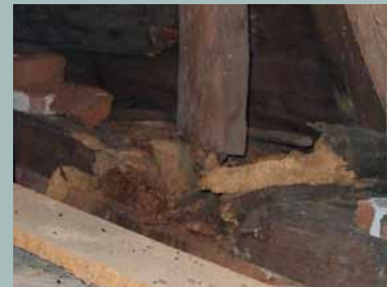
Rozpad pozednice (uvolnění spoje).