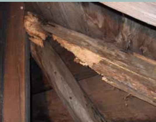
Zničené prvky – prolomení krokví.