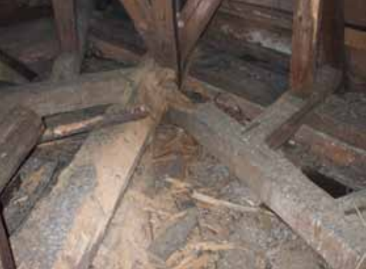
Oslabení a ztráta tuhosti krovu.