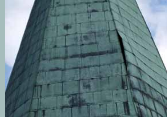
Netěsnost střešní krytiny od deformací.